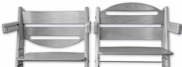
Správně umístěná zvýšená opěrka zad

1. Odhadneme nebo změříme vzdálenost od konce pánevní kosti po konec prohnutí páteře směrem dopředu (výšku beder) a rozhodneme, zda použijeme jednu nebo dvě opěrky zad nebo pouze širší z opěrek. Pro děti do dvou let použijeme obě opěrky zad. Vyšší z nich ( ZVO ) vložíme do prvního otvoru shora v případě, že sedák musí mít dítě vzhledem k vašemu stolu v nejvyšší poloze. Pokud sedák bude mít dítě nastavený ve druhé drážce shora, nasadíme širší opěrku do čtvrtého otvoru shora, obloukem směrem dolů. Tím zamezíme podklouznutí malého dítěte prostorem pod opěrku.